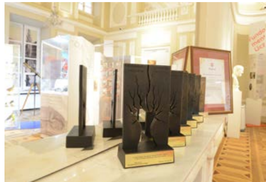
Nagrody w XV edycji konkursu „Mazowieckie Zdarzenie Muzealne – Wierzba”

W katalogu zaprezentowano obiekty ze 106 jednostek. Dotyczą one zarówno historii szkół wyższych, jak i efektów badań naukowych przez nie prowadzonych. Nie zabrakło w nim też obiektów z trzech wspomnianych muzeów naszej uczelni. Zaprezentowa-